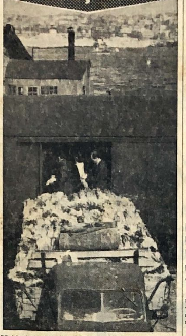
B.K. defa olarak marmarabirinden 18 bin pırasa Almanya'ya gönderildi. Nümuneler olarak gönderilen bu pırasalar, marmarabirinden 18 bin pırasa Almanya'ya gönderildi. Nümuneler olarak gönderilen bu pırasalar, marmarabirinden 18 bin pırasa Almanya'ya gönderildi.