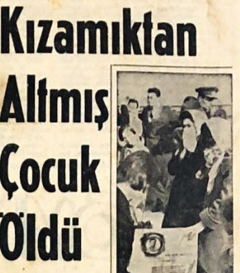
Bingöl'de kızamıkla altmış çocuk öldü.

Bingöl, 1 (Hürriyet) — Merkezde bağlı Sancak mahallesi köylerinde, çocuklar arasında görülen kızamık ve dizanteri hastalığı süratle yayılmaktadır.