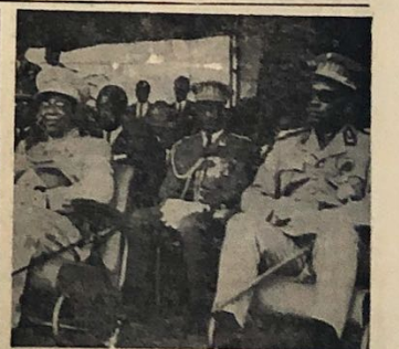
Darbe ve sonrası — Konya'da bir hükümet darbesi deviren ve yerine geçen General Mobutu, dün devirdiği Re- kas ile görüşmüştür. Bildirildiği gibi eski Başkan ve adamları hakim enformel buluşmalarda. Fotoğraf, bir türünde Reas- vada ile Mobutu beraber görüşüyorlar.

ANKARA Sanayi Bakanı Mehmet Tur- kut, Rusya ve demirper- de memleketlerinin anlaş- malarına riayet olarak, rus- tıların gönderdikleri kalitesiz ve pahalı mallara ilgili haberini- si teyid etmiş ve "Rusya'dan ge- lenek bütün mallar büyük bir titizlikle kontrola tabi tutu- lacaktır. Ayrıca yurt dışında ku- rulacak olan sanayilerdeki mal- ın mülakat raporları verildi- ken sonra ancak kullanıla- caktır" demiştir. (Devamı 9. S. 58-59)