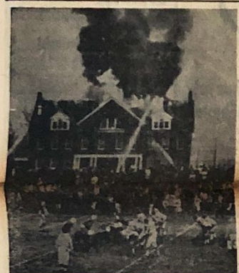
Yangın ve maç — Amerika'da Horvats Kralı ile De- erford akademisi arasındaki futbol maçını en heyecanlı anında sahnenin yakınındaki bir binada yangın başlamıştır. Oyuncular ve seyirciler önce yangına önem vermişler ancak bir müddet sonra olayların yayılmasını kısıtlama amacıyla yangına müdahale etmişlerdir. Fotoğraf, yangın devam ederken futbol oyuncuları te- lesiz ediyor.