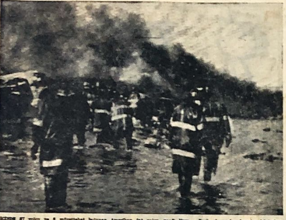
KURUM 47 yolcu ve 4 mürettebat bulunan Amerikan jet yolcu uçağı New - York'ta Amerika'da bir jet düştü, 95 ölü var.

Mısır'da dört katlı bir otel çöktü ve kırk kişi öldü