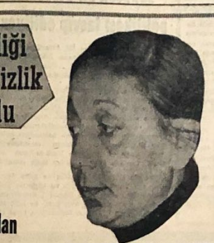
Öğretmenliği bırakıp temizlik amiri oldu