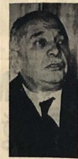
Fahrettin Kerim Gökay

SPOR - TİYATRO Yeni — La. Spor (0-2) 2 F. Balçık — Altay (1-0) 1 0. Bülent-Dryden (0-1) 1 Yelizer-S. Spor (0-0) 0 Yıldırım-D. Spor (2-0) 2 Kılıç-Spor-Egemen (0-2) 2